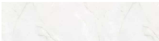
ブランオニキス柄/HAS2A901E