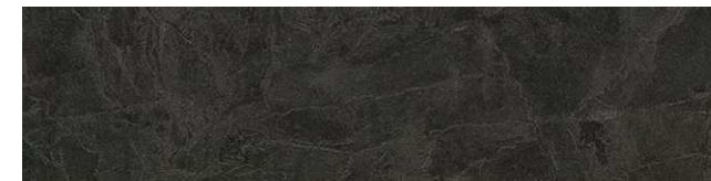
ブラックスレート柄/HAS2TA05E