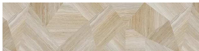
セルベジャンテモザイク柄/HAS2A905E