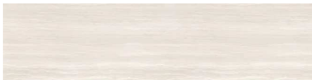
グレースセルベ柄/HAS2A903E