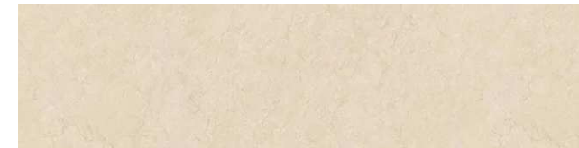
クレママーフィル柄/HAS2TA04E