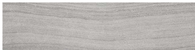
フローライムストーン柄/HAS2A904E