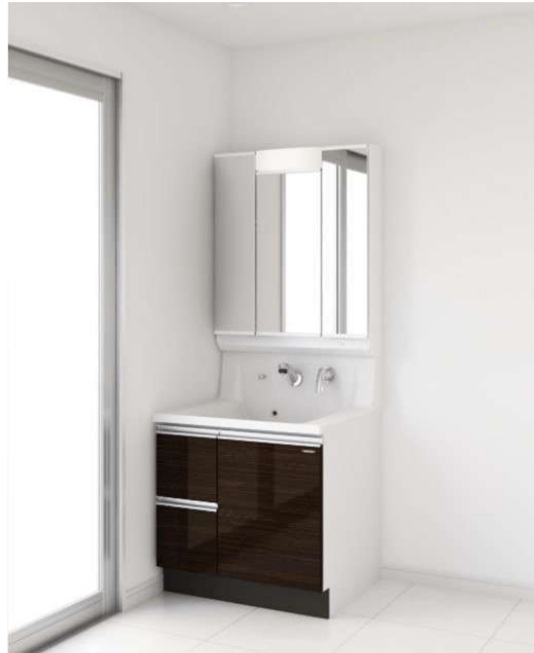
画像はイメージです。水栓はメッキタイプになります。